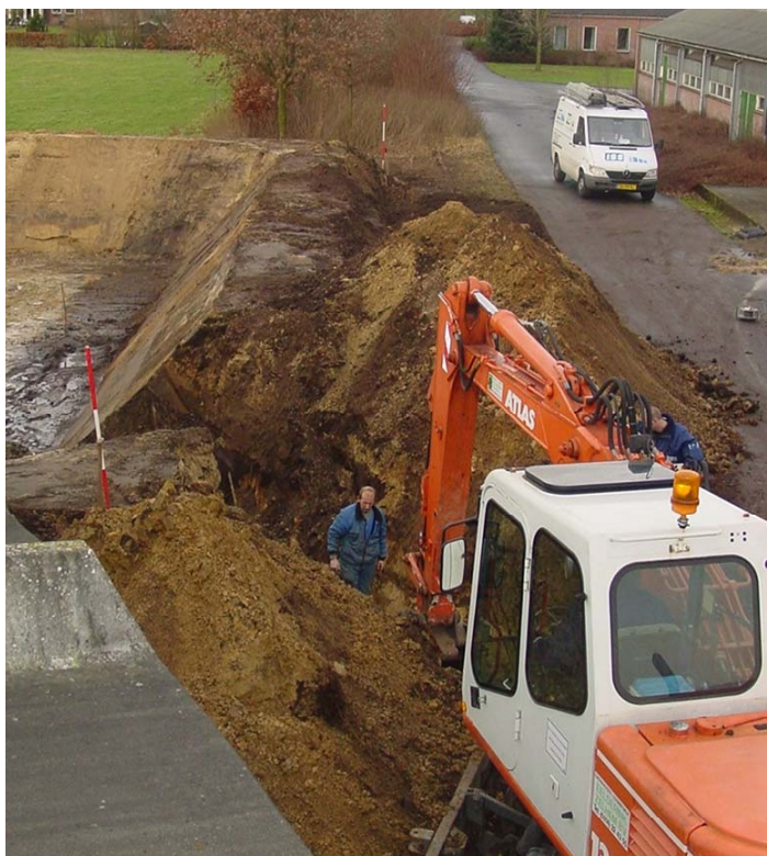
De bouw van de mestvergistingsinstallatie op De Marke

Voor de bouw van een object is in bijna alle gevallen een bouwvergunning vereist. Op De Marke is t.b.v. de vergistingsinstallatie een mestzak en een container geplaatst. De mestzak valt onder de verordening mestopslagen waarvoor geen bouwvergunning vereist is maar een melding afdoende is. Dit betekent dat alleen voor de container een bouwvergunning is aangevraagd en afgegeven. Omdat de bouw van de installatie binnen het bouwblok van het bedrijf viel was de gemeente het bevoegd gezag.