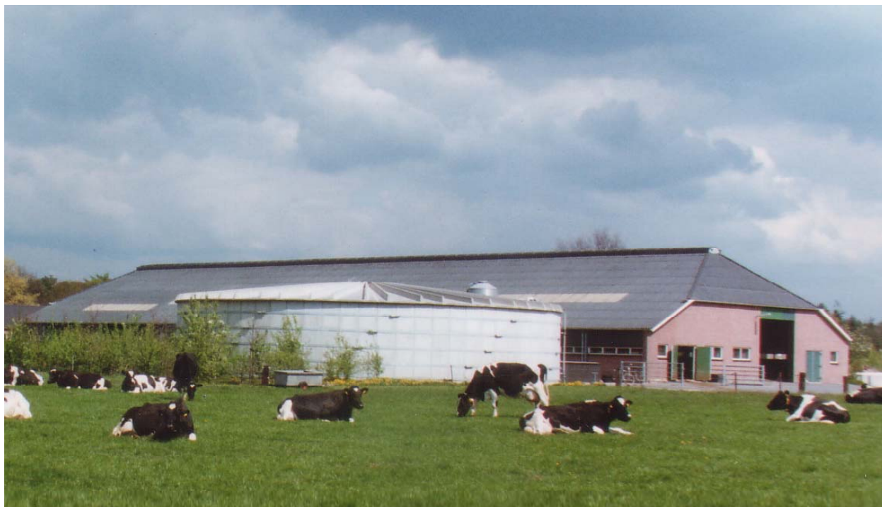
Het praktijkcentrum De Marke, met aan de zijkant van de stal de grote mestsilo