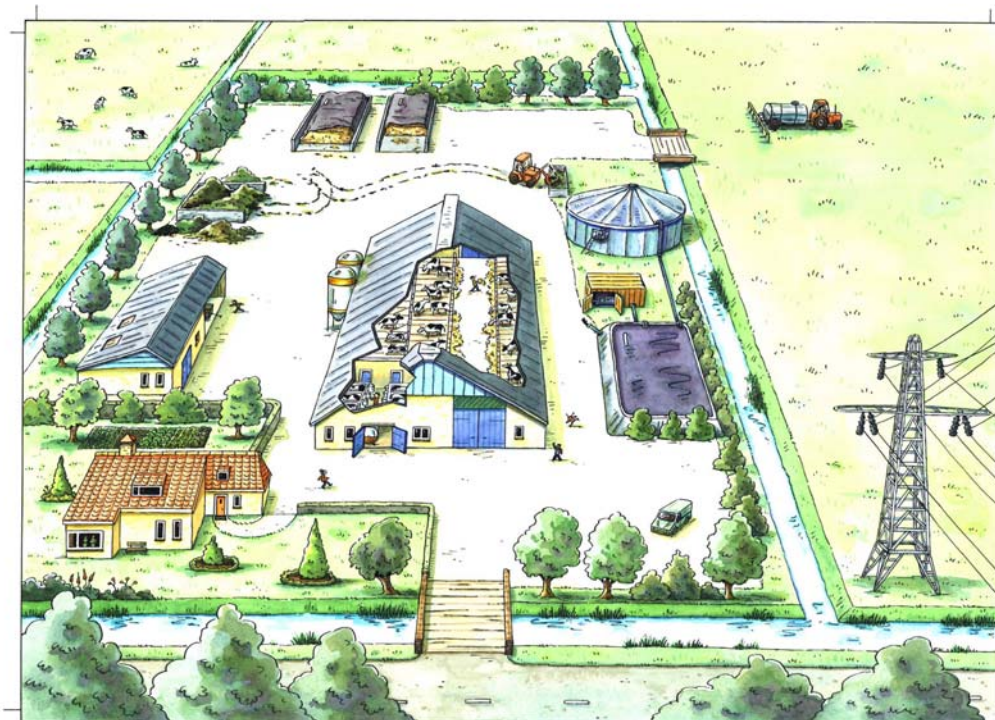
Figuur 2 Afbeelding van een modern melkveebedrijf met vergisting dat voor voorlichting is en wordt gebruikt

De mestvergistingsinstallatie is in februari 2003 feestelijk geopend door de voormalige Minister van LNV, de heer Braks. De opening vond plaats tijdens de open dagen van De Marke die door zo'n 2500 bezoekers zijn bezocht. Bij de vergister was een ruime informatiestand ingericht waar het CLM de onderzoeksmatige achtergrond van de vergister op De Marke uitlegde en de leverancier van de installatie informeerde over de technische details. Ten behoeve van de opening is voorlichtingsmateriaal gemaakt met info over vergisting (bijvoorbeeld posters). Daarvoor is o.a. gebruik gemaakt van een tekening dat een modern melkveebedrijf met vergisting uitbeeldt (figuur 2). Na de opening is een video/DVD gemaakt over mestvergisting op De Marke.